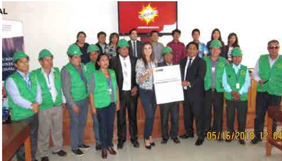
MINERA LA VERDE