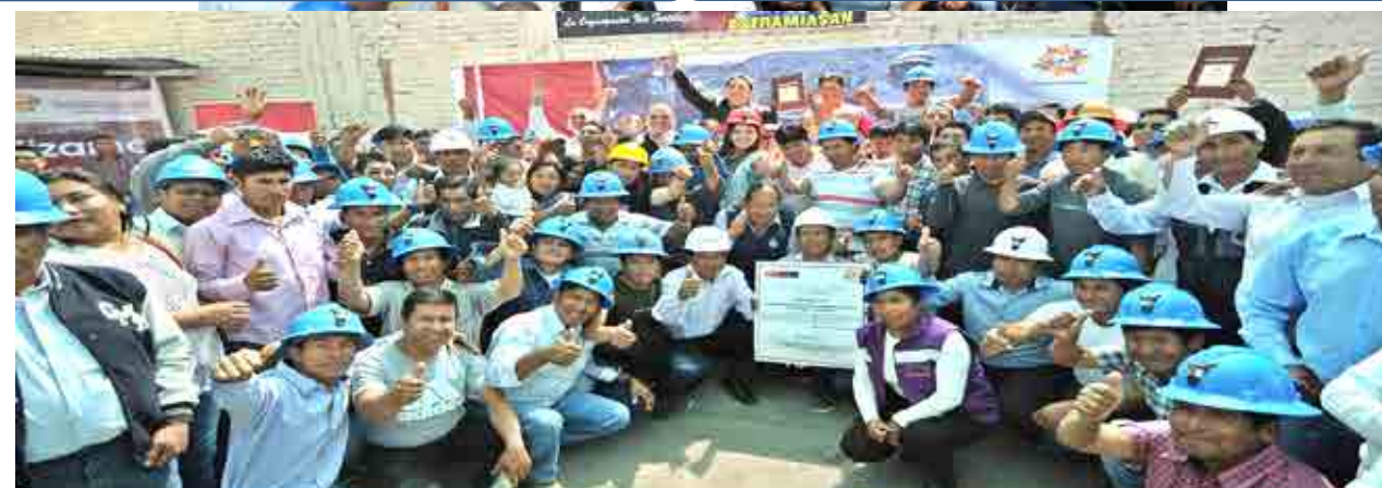
BASE MINERA SAN CRISTOBAL