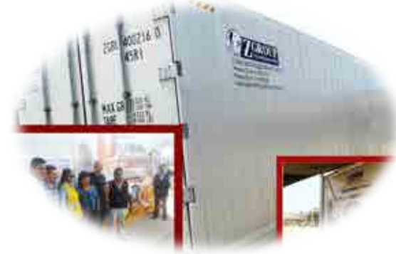
AEO ASARPAHP - MATARANI - ISLAY