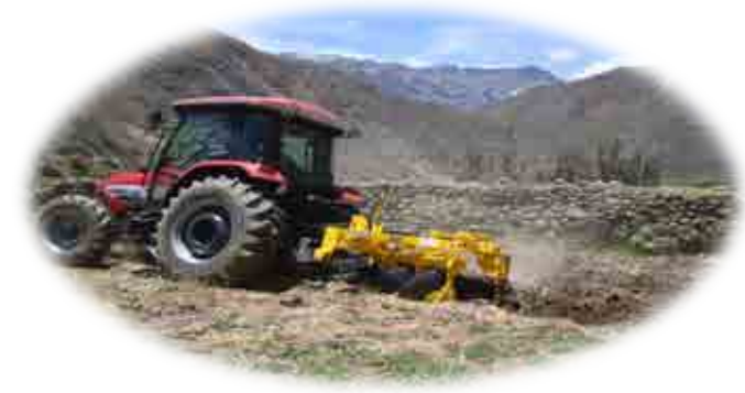
AEO DISTRITO ALCA – LA UNIÓN