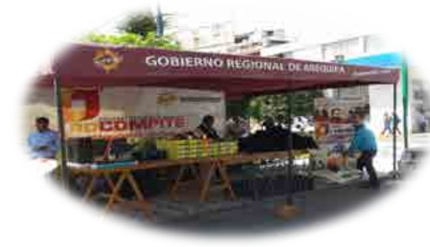
AEO CONDOROMA - RIO TAMBO - ISLAY