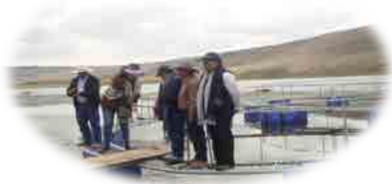
AEO ARCO IRIS – ARCATA -ORCOPAMPA – CASTILLA