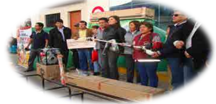
AEO YAUCA - CARAVELÍ