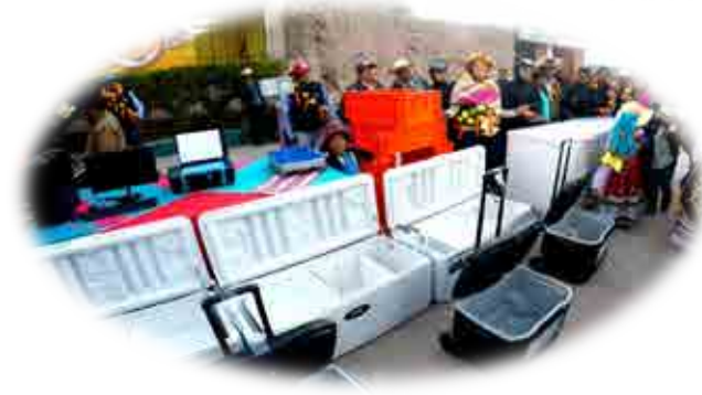
AEO HUAMBO SATAY - CAYLLOMA