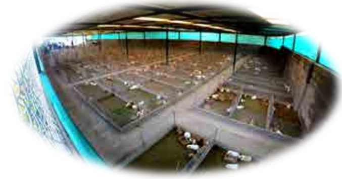
DISTRITO CHARACATO - AREQUIPA