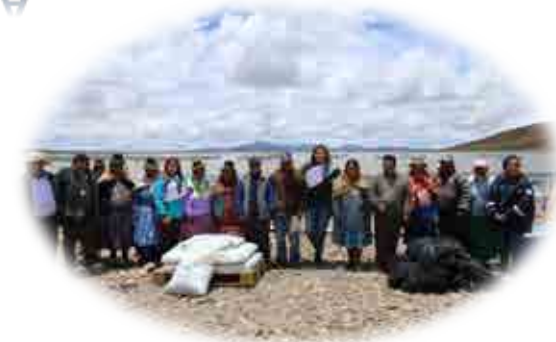
AEO VINCOFISH – IMATA - AREQUIPA