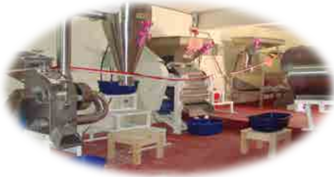
AEO DISTRITO COTAHUASI – LA UNIÓN