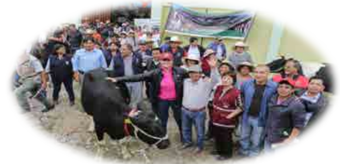
AEO DISTRITO IRAY - CONDESUYOS