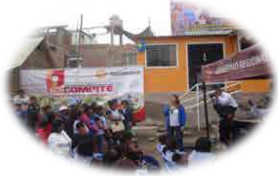
AEO PUERTO DE QUILCA - CAMANÁ