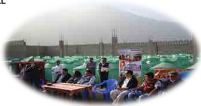
AEO JAQUI - CARAVELÍ