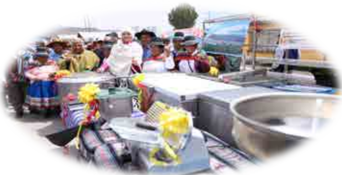
AEO DISTRITO ORCOPAMPA - CASTILLA