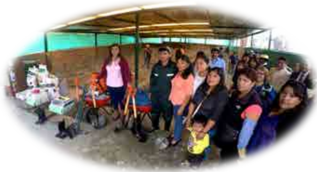
AEO VIRGEN DE LA FUENTE