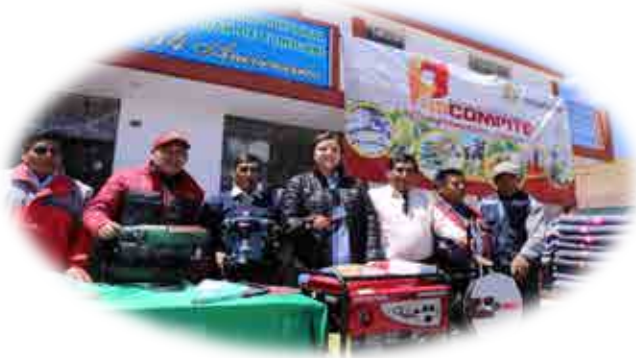
AEO SAN JUAN DE TARUCANI - AREQUIPA