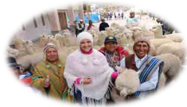
AEO DISTRITO DE ORCOPAMPA - CASTILLA